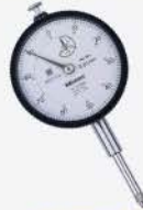
Indicador de carátula 0-20 mm