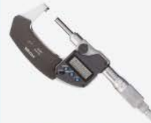
Micrómetro Dig. S/Rot 0-1\"/>