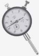
Indicador de carátula 0-0.5"