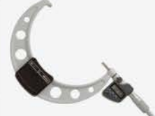
Micrometro Dig. 6-7"/150-175 mm