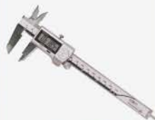
Calibrador Dig. 8\"/>