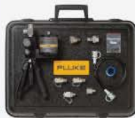
Kit para Bomba de Prueba Hidráulica 10,000PSI