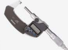
Micrómetro Dig. S/Rot 0-1"/0-25 mm