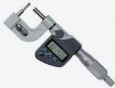
Micrómetro Digimatic 0-1\"/>