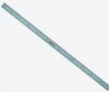
Regla Flexible 12"