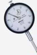
Indicador de carátula 0-20 mm