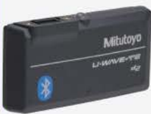
Transmisor Bluetooth para Calibrador (IP67)