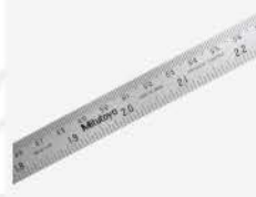
Regla Semiflexible 40"/1000mm