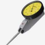
Indicador de Pestaña 0.5 mm