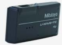
Transmisor Inalámbrico Fit para Calibrador (Zumbador)