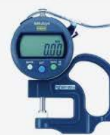
Medidor de Espesores Dig.