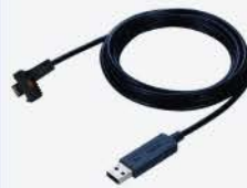
Cable para envío de datos a computadora USB-ITN-A