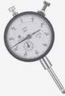
Indicador de carátula 0-1"