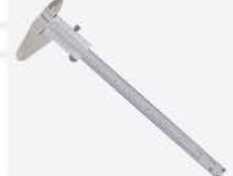
Calibrador Vernier 8"