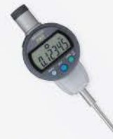
Indicador Dig. IDC 1"/25 mm