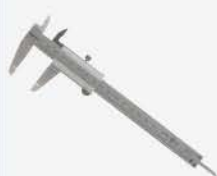
Calibrador Vernier 300 mm