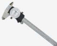
Calibrador de carátula 0-6\"/>