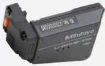
Interface de conexión (IP67)