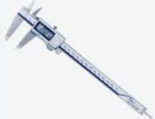
Calibrador Dig. 200 mm IP67