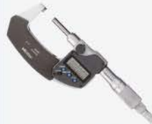
Micrómetro Dig. S/Rot 0-1\"/>