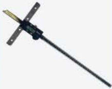
Calibrador de Profundidad Dig. 18"/450 mm