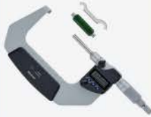
Micrómetro Dig. S/Rot 2-3\"/>