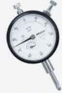
Indicador de carátula 0-0.5"