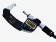
Micrometro Dig. QuantuMike 1-2"/25-50 mm