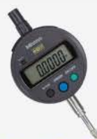
Indicador Dig. IDS .5"/12 mm