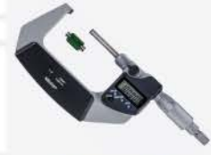
Micrómetro Dig. S/Rot 1-2\"/>