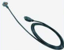
Cable de conexión SPC 1m