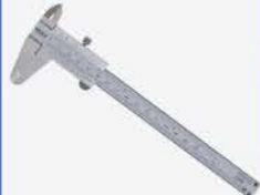
Calibrador Vernier 150mm/6"