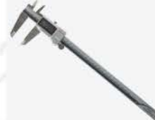
Calibrador Dig. 200 mm IP67