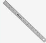
Regla Semiflexible 6"/150 mm