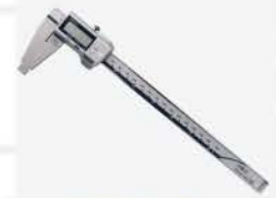
Calibrador Dig. 8"/200 mm (IP67)