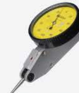
Indicador de Pestaña 0.2 mm