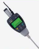
Indicador Dig. 2"/50 mm