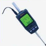
Indicador Dig. ID-H 60.9 mm