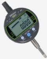
Indicador Dig. IDC 1"/25 mm