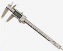
Calibrador Dig. 8\"/>