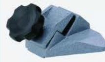
Base para Micrómetro