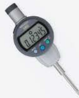
Indicador Dig. IDC 1"/25 mm