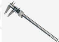
Calibrador Dig. 200 mm IP67