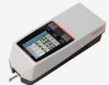
Medidor de Rugosidad SJ-210 IN 0.75 mN Standard