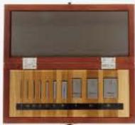
Jgo. de Block Acero 10 Pzas.