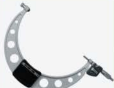
Micrometer Dig. 6-12\"/>