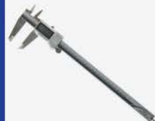
Calibrador Dig. 200 mm IP67