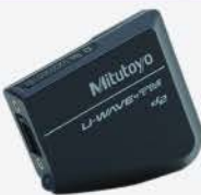
Transmisor Inalámbrico Fit para Micrómetro (IP67)