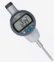
Indicador Dig. IDC 25 mm