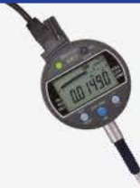
Indicador Dig. IDC 1"/25 mm