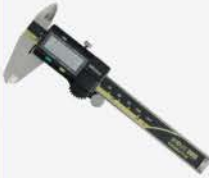
Calibrador Dig. 4\"/>